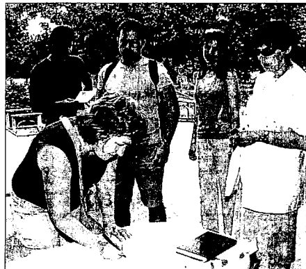
Хората трябва да внимават в какви подписки дават личните си данни.

Веднъж дадена информацията във Фейсбук трудно може да бъде премахната.