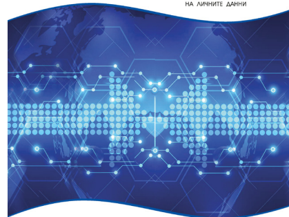
ОСНОВАНИЯ ЗА ЗАКОНОСЪОБРАЗНОСТ НА ОБРАБОТВАНЕТО НА ЛИЧНИ ДАННИ